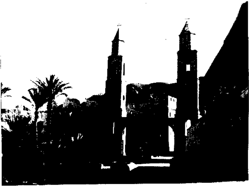
دير القديس العظيم الأنبا أنطونيوس

مبارك هو اليوم ، الذي قبل فيه الأنبا أنطونيوس ، أن يرشد آخرين ، ويعلمهم هذا الطريق الملائكى الذى اختبره *