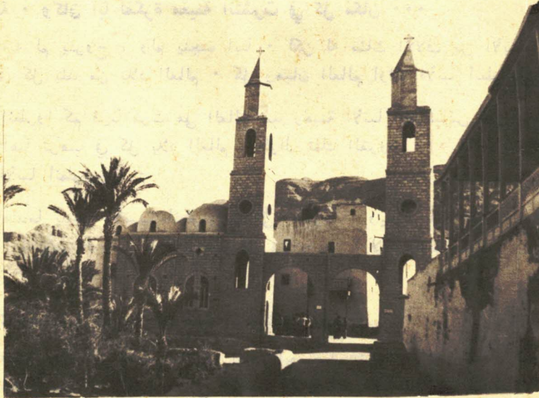
دير القديس العظيم الأنبا أنطونيوس

مبارك هو اليوم ، الذي قبل فيه الأنبا أنطونيوس ، أن يرشد آخرين ، ويعلمهم هذا الطريق الملائكى الذى اختبره •