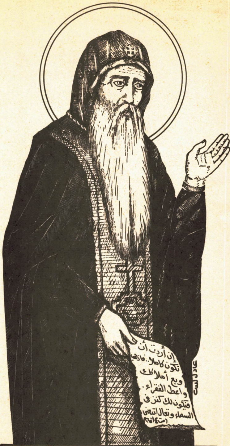
القديس العظيم الأنبا أنطونيوس