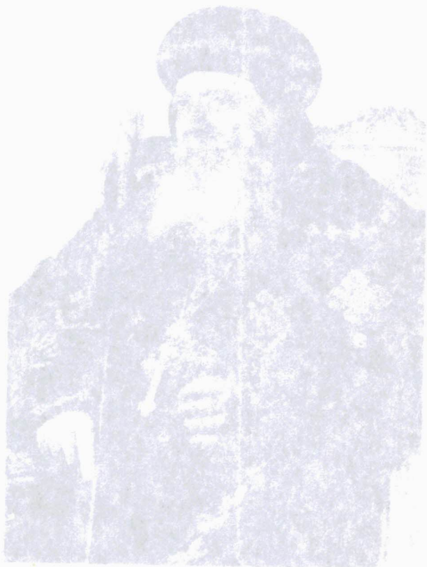
شالينا هيمس ليليا خسانة خيسقيا قزاقا قاير لاه و قوسنخسقا لاه