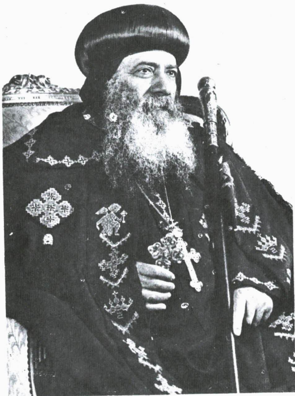
قداسة البابا شنوده الثالث بابا الإسكندرية وبطريك الكرازة المرقسية