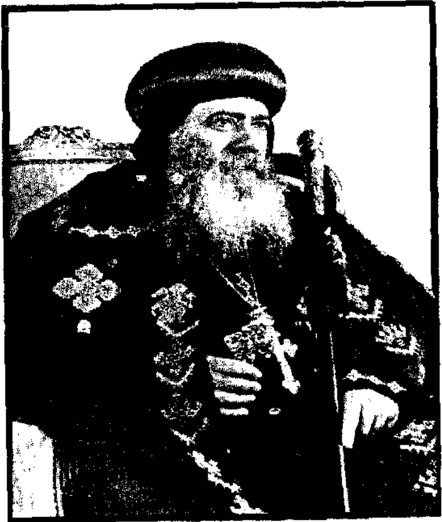
صاحب القبطية البيايا العظيم الأنبا شنودة الثالث